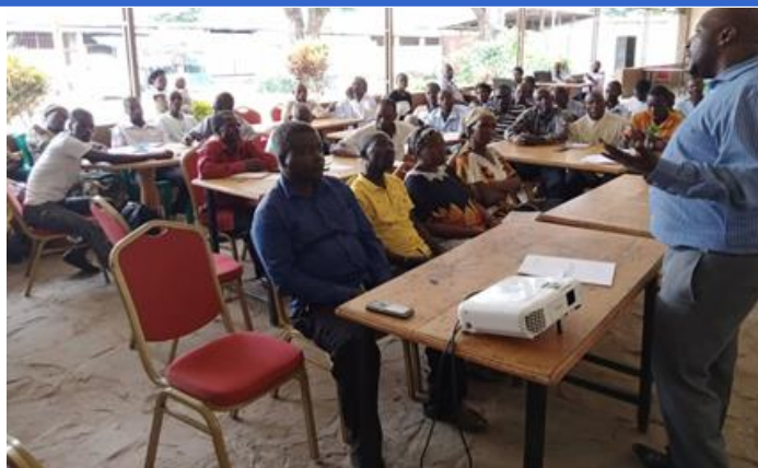
Vue des participants à la formation

Dans le cadre de la recherche des opportunités d'accès au crédit agricole en faveur de petits producteurs, Rikolto a organisé, le 27 et 28 novembre 2021, une séance de prise de connaissance des conditions d'accès aux crédits du PAIDEK SA et de formation en éducation financière, au profit des membres des coopératives agricoles de Kavinvira, Kilomoni et Kiliba, rayon d'action de cette institution financière.