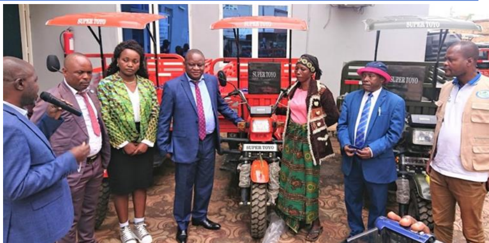
Le Ministre provincial Robert BYACANDA procédant à la remise des tricycles aux bénéficiaires en présence de l'IPA & IPEL

Le Projet Intégré de Croissance Agricole dans les Grands-Lacs "PICAGL" a procédé, le jeudi 2 décembre 2021 à Bukavu, dans la province du Sud-Kivu, à la remise des motos tricycles aux associations et coopératives agricoles bénéficiaires de ses interventions dans la Province du Sud Kivu.