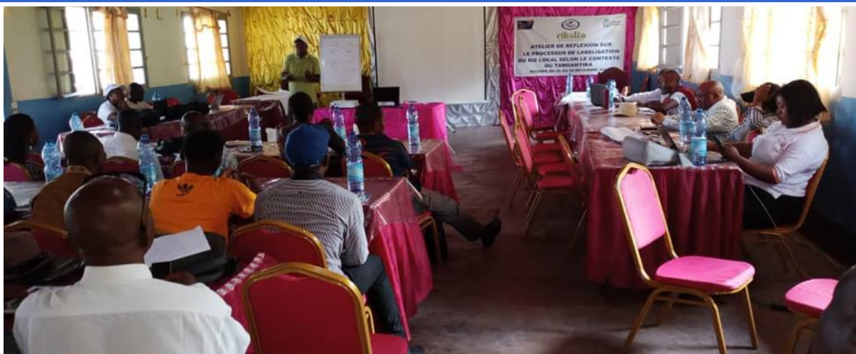
Les participants à l'atelier concentrés sur ce qui est dit pendant la formation

La salle paroissiale Saints Albert et Victor de Kalemie a servi de cadre à l'atelier de réflexion sur le processus de labélisation du riz local selon le contexte du Tanganyika, du 23 au 25 novembre 2021. Cette activité, organisée par RIKOLTO, dans le cadre du PICAGL, a regroupé les acteurs évoluant dans tous les maillons de la chaîne de valeur riz au Tanganyika avec comme objectif de contribuer au processus d'analyse et d'élaboration de la stratégie pour la promotion de la chaîne de Valeur riz en aboutissant à un label du riz local.