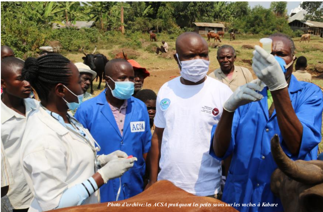
Photo d'archive: les ACSA pratiquant les petits soins sur les vaches à Kabare

Aux éleveurs, il a été recommandé de faire confiance et de collaborer avec les Agents Communautaires de Santé Animale, ACSA ainsi que les Cabinets Vétérinaires Privés de Proximité installés par le Ministère de tutelle dans le cadre du PICAGL.