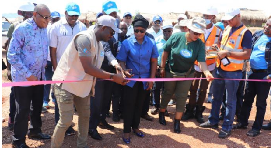
Coupage du ruban symbolique sur la route Kanowa-Mulange Rail par la Ministre provinciale du Genre

Le Projet Intégré de Croissance Agricole dans les Grands-Lacs, PICAGL en sigle a procédé le samedi 20 novembre 2021, à la remise officielle des axes routiers réhabilités, des Centres Communautaires des Transformation de Manioc (CCTMa) et de 7 motos, aux autorités provinciales du Tanganyika.