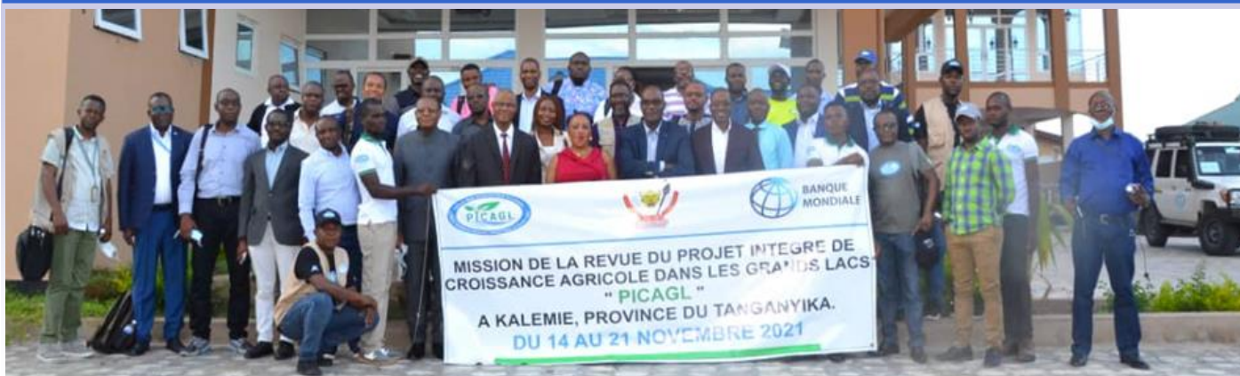
Photo de famille entre la Banque mondiale, l'équipe PICAGL et les partenaires après la revue des plans d'action des partenaires de mise en œuvre du PICAGL à Kalemie

La prolongation et la restructuration du PICAGL étaient au centre des échanges entre l'équipe de la Banque Mondiale et le Staff dirigeant du Projet, à Kalemie, du 14 au 21 novembre 2021, en marge de la mission de technique de revue détaillée du plan d'action de ce grand projet régional qui s'exécute dans les provinces du Tanganyika et du Sud Kivu.