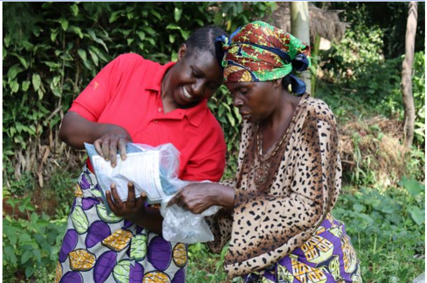
Vue des femmes paysannes de Kalehe contentes et prêtes à appliquer AFLASAFE RDC 01 dans leurs champs

Dans le cadre du Projet Intégré de Croissance Agricole dans le grand lacs, PICAGL, l'Institut International d'Agriculture Tropicale IITA, a entamé une série de sensibilisations sur l'application du produit AFLASAFE RDC 01 dans les champs de paysans, afin d'améliorer leur production agricole.