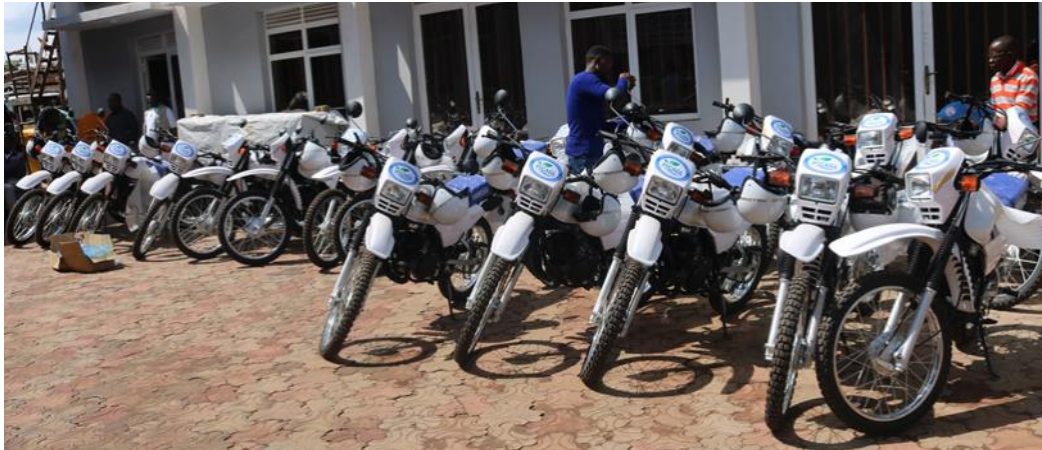
Des motos YAMAHA DT 125 au profits des Inspections et services spécialisés du secteur agricole

Le Projet Intégré de Croissance Agricole dans les Grands-Lacs "PICAGL" a procédé à la remise des motos tout terrain de marque YAMAHA DT 125 aux agents des Inspections provinciales et territoriales de l'Agriculture, Pêche et Elevage et du Développement rural, ainsi qu'aux services spécialisés du Ministère de l'Agriculture en province du Sud-Kivu.