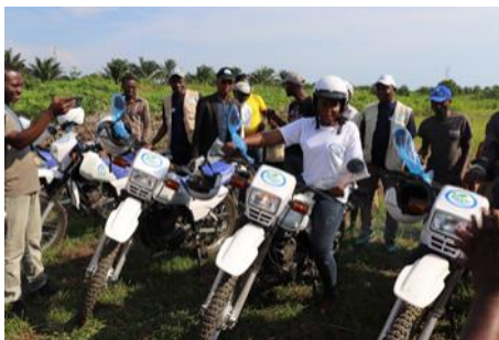
La Coordonnatrice Provinciale du SNV contente de recevoir sa moto

Grâce au PICAGL, 7 CCTMa sont sortis de terre dans le territoire de Kalemie précisément dans les villages de Kahengele, Lukwangulo, M'toa, Kabimba, Miketo et Mulange, favorisant ainsi le développement communautaire à la base.